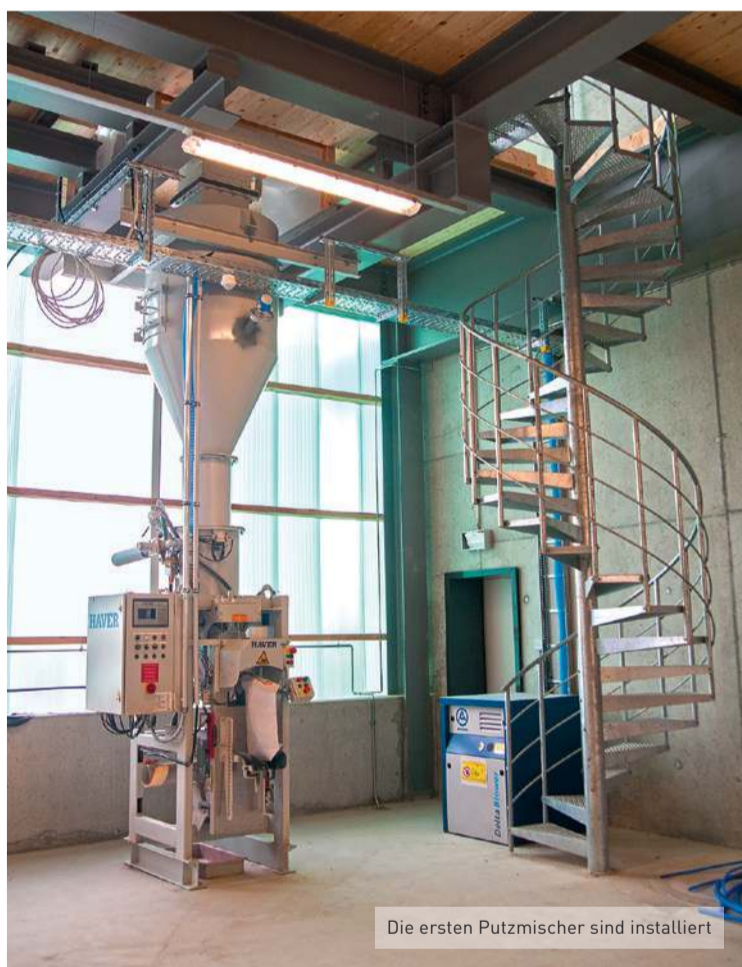
Die ersten Putzmischer sind installiert