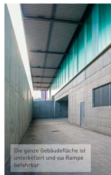
Die ganze Gebäudefläche ist unterkellert und via Rampe befahrbar