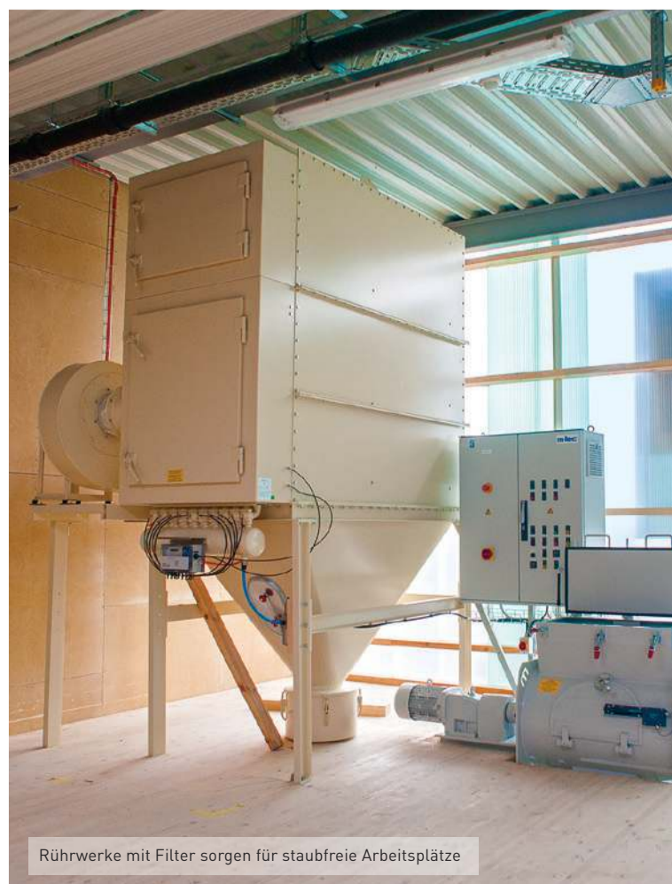
Rührwerke mit Filter sorgen für staubfreie Arbeitsplätze

Selbstverständlich wurde der Neubau unter dem Gesichtspunkt ökologischer Bauweisen geplant und umgesetzt. Nebst dem Einsatz von HAGA Naturbaustoffen hiess das beispielsweise, dass die Wände möglichst transparent gebaut wurden, um den Stromverbrauch für die künstliche Belichtung gering zu halten. Tageslicht ist nicht nur ökologischer, sondern auch für die Mitarbeitenden gesünder. Ein grosser Teil der Aussenwand im Bereich der Produktion wurde mit Platten aus Polycarbonat erstellt, das dank seiner Transparenz Licht durchlässt und dennoch einen hohen Isolationswert aufweist.